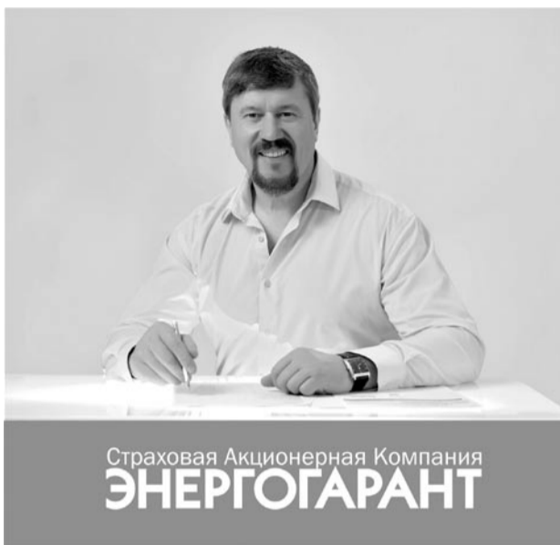
Страховая Акционерная Компания ЭНЕРГОГАРАНТ

В ноябре 2019 года Южно-Уральский филиал страховой компании «Энергогарант» отметит свое 25-летие. Все эти годы в компании работает программа «Высокое качество защиты».