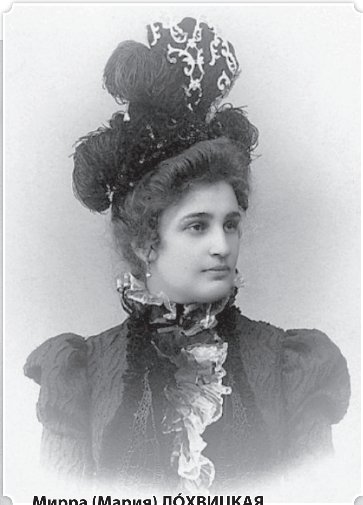
Мирра (Мария) ЛОХВИЦКАЯ