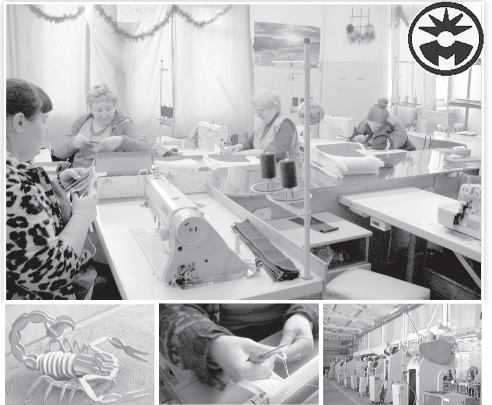
ООО «МагСвет». 455019, пр. Пушкина, 8, г. Магнитогорск, Челябинская область. Контактный телефон +7-(3519)48-28-22

ство, оборудованное машинами, на которых качественно и в срок выполняются заказы на пошив спецодежды (костюмов, комбинезонов, сигнальных жилетов, рабочих рукавиц), постельного белья и других изделий...