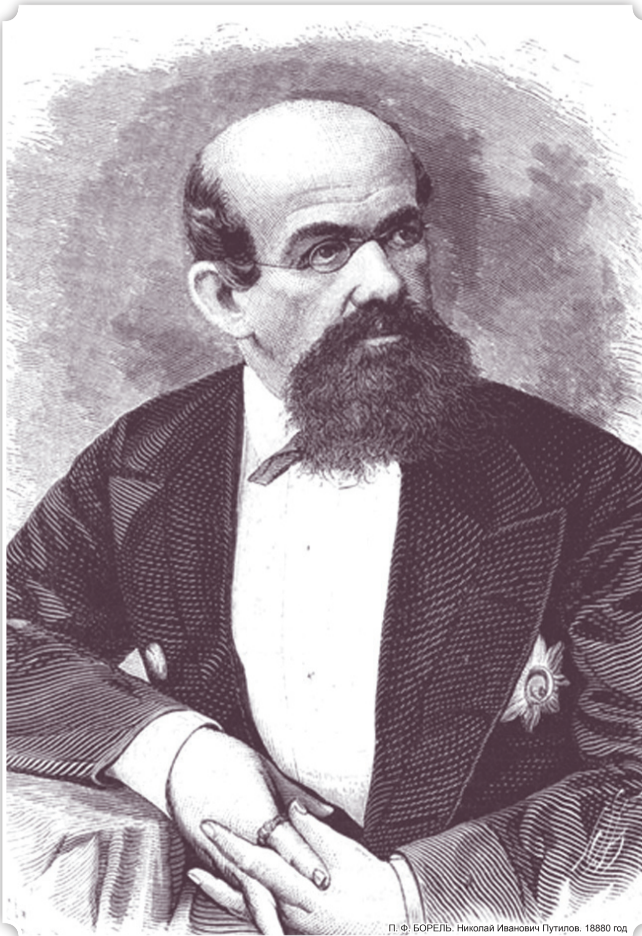
П. Ф. БОРЕЛЬ. Николай Иванович Путилов. 18880 год

Есть в истории России имена, которые оказались не под силу бесследно стереть с её страниц политическим пристрастиям времени.